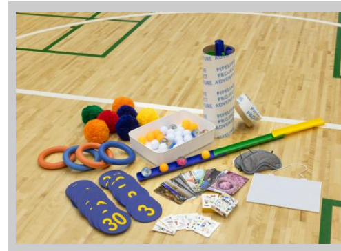
チームビルディング