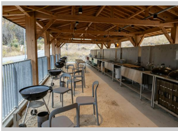
バーベキュー施設